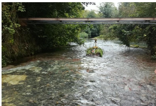
Ouvrage en cours de arasement