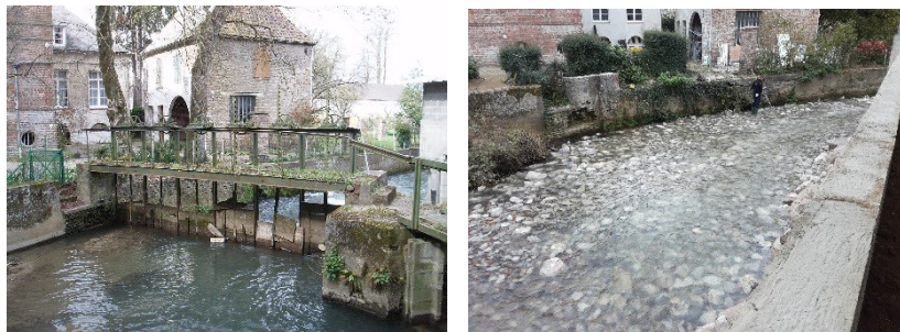
Ouvrage avant et après travaux