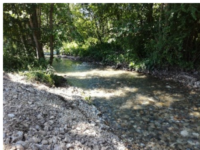
Ouvrage avant et après travaux