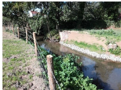
Ouvrage avant et après travaux