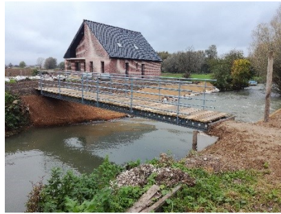
Ouvrage avant et après travaux