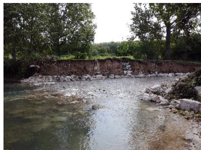
Ouvrage avant et après travaux