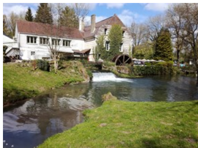
Ouvrage avant et après travaux