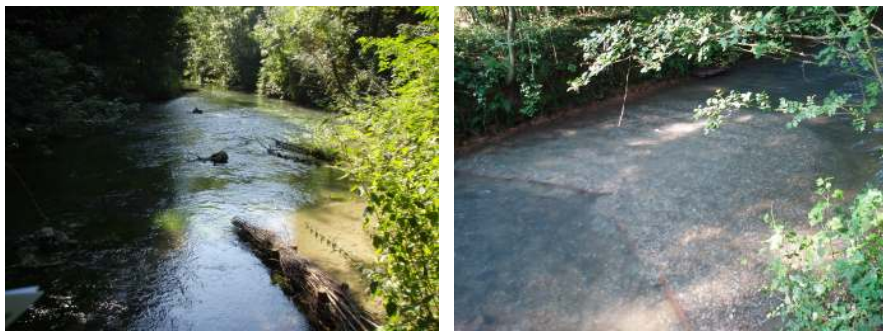
Le site en 2008