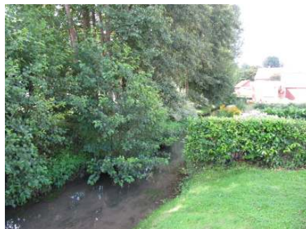
Le site en 2008 et 2010