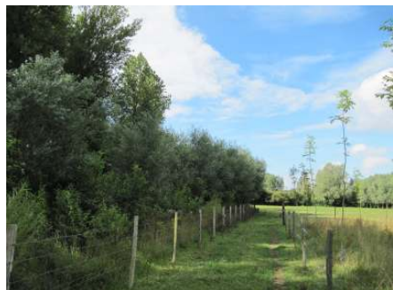
Le site en 2008 et 2010