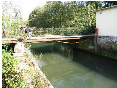
Ouvrage avant et après travaux