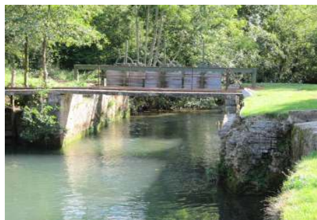
Ouvrage avant et après travaux