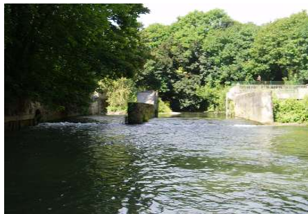
Ouvrage avant et après travaux